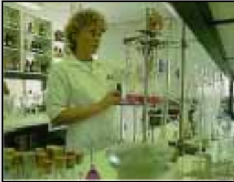
Tætte og resistente gulve