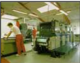
Optager bevægelserne fra trykkerimaskiner