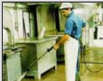
Fugefrit, rengøringsvenligt alternativ til klinker

Det skal være trygt at vælge en ny løsning til virksomhedens gulve. NM 100 Gulv fra Rockidan har eksisteret i mange år, og med belægningen følger lang tids erfaring med forarbejde, udlægning og vedligeholdelse af netop denne gulvtype. Masser af referencer samt testresultater fra Teknologisk Institut giver vished for systemets slidstyrke og resistens.