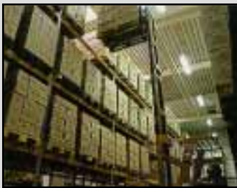
Minimerer støvproblemer på lagervarer