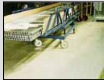
Slagfast belægning der tåler slag fra rørender